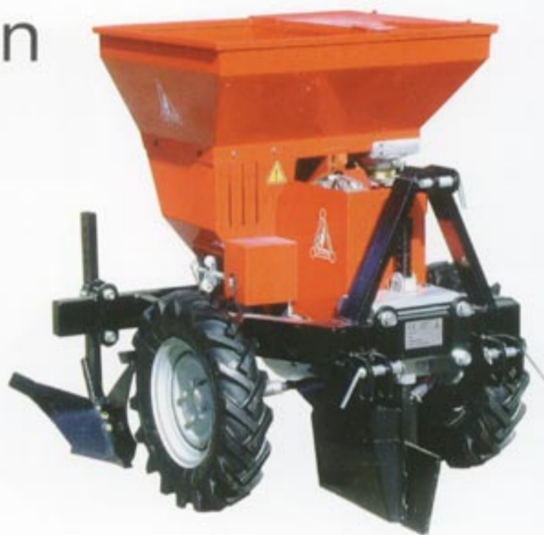
Plantadora de 1 surco

Nuestra experiencia avalada por muchos años de investigación y desarrollo en el sector agrícola nos permite presentar una nueva generación de plantadoras de patatas de la más elevada eficacia y adaptación al tipo de plantación que se realiza en nuestro país. En esencia son máquinas muy robustas y de un escaso mantenimiento para facilitar la labor en las más duras condiciones.